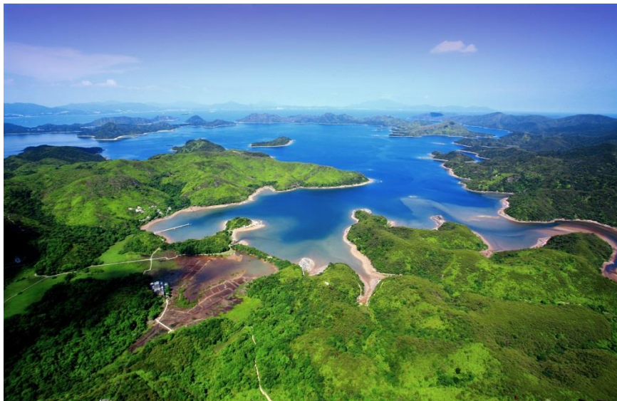
都会の生活から離れ、ひと時の休息が取れる香港の豊かな自然。

熱心なハイカーは、マクリホース・トレイル（全長 100km）、ランタオ・トレイル（70km）、香港トレイル（50km）、ウィルソン・トレイル（78km）に挑戦するのも良いでしょう。