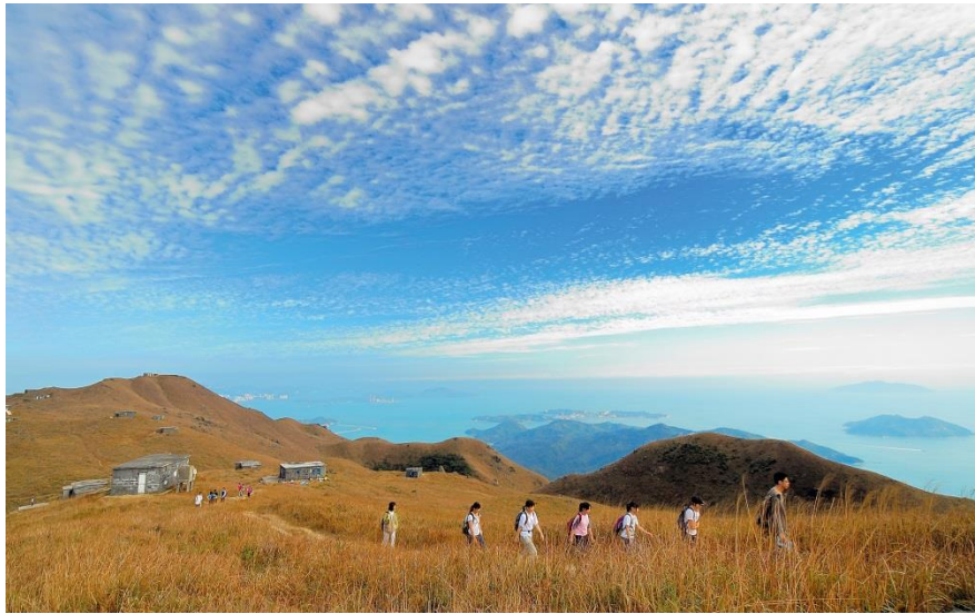
香港でのハイキング。

高級なショッピングモールから賑やかな露店街、古代中国の寺院からガラス外壁の超高層ビル、そしてネオン輝く街中から緑あふれる田園地帯まで、香港は色彩とコントラストに満ち、古代と超現代、東洋と西洋が混在する魅惑的な場所です。美しい自然公園、趣ある離島や世界遺産のジオパークはみな、中心部から少し足を延ばすだけで訪れることができます。